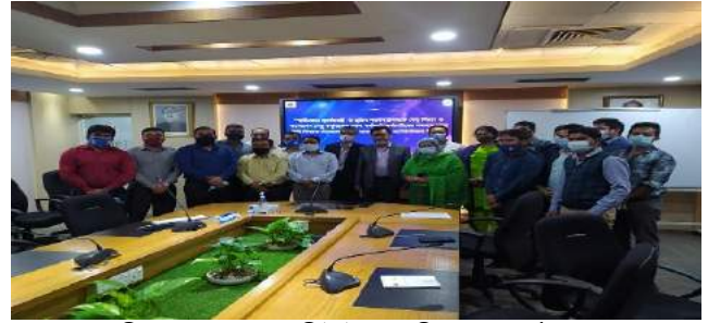
চিত্র : মাস্ক ও স্যানিটাইজার বিতরণ কার্যক্রম

জাতির পিতা বঙ্গবন্ধু শেখ মুজিবুর রহমান এর জন্মশতবার্ষিকী ও স্বাধীনতার সুবর্ণজয়ন্তী উপলক্ষে ১৫ ডিসেম্বর ২০২১ তারিখে স্বাধীনতার সুবর্ণজয়ন্তী ও মুজিব শতবর্ষ উপলক্ষ্যে সেতু বিভাগ এবং বাংলাদেশ সেতু কর্তৃপক্ষের কর্মকর্তা-কর্মচারীদেরকে স্বাস্থ্য বিধি বিষয়ক সচেতনতা সৃষ্টির লক্ষ্যে ১২৩টি মাস্ক ও স্যানিটাইজার বিতরণ করা হয়।