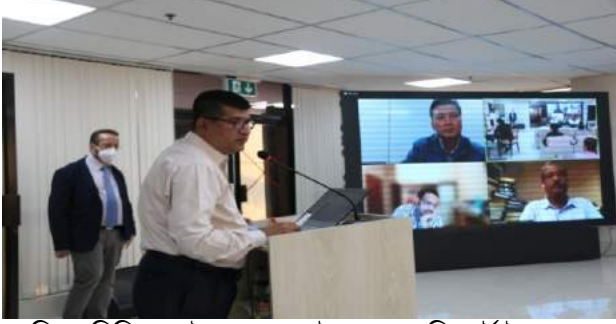
চিত্র : বিবিএ মাস্টার প্লান-এর ইনসেপশন রিপোর্ট উপস্থাপন অনুষ্ঠানে নির্বাহী পরিচালক

গত ০২ সেপ্টেম্বর ২০২১ তারিখে বাংলাদেশ সেতু কর্তৃপক্ষের মাস্টার প্লান প্রকল্পের ইনসেপশন রিপোর্ট উপস্থাপিত হয়।