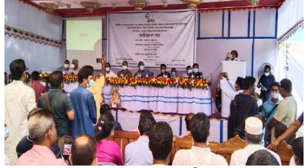
চিত্র : উড়াল সড়ক-এর অংশীজন সভা