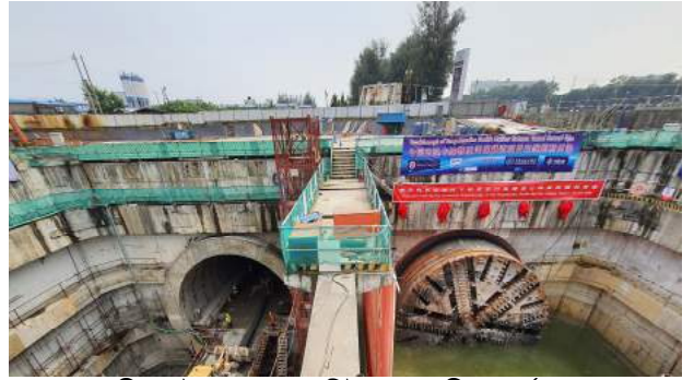
চিত্র : টানেলের ২য় টিউবের বোরিং কার্যক্রম

চট্টগ্রামে বঙ্গবন্ধু শেখ মুজিবুর রহমান টানেলের দ্বিতীয় টিউবের খনন কাজ ০৭ অক্টোবর ২০২১ তারিখ সম্পন্ন হয়েছে। টানেলে নদীর অংশে তৈরি করা হয়েছে দু’টি টিউব। ইতোমধ্যে প্রথম টিউবের ভিতরের রাস্তার কাজ শেষ হয়েছে এবং দ্বিতীয় টিউবের ভিতরের রাস্তার কাজ চলমান রয়েছে। নির্মিতব্য টানেলটি চালুর পর অর্থনৈতিক প্রবাহে আসবে আমূল পরিবর্তন। আর এটি হবে দক্ষিণ এশিয়ায় নদীর তলদেশে প্রথম টানেল। টানেলটির একটি প্রান্ত পতেঙ্গা হতে শুরু হয়ে আনোয়ার প্রান্ত শেষ হয়েছে। বঙ্গবন্ধু টানেলকে কেন্দ্র করে এরই মধ্যে কর্ণফুলী নদীর ওপারে প্রস্তুত কোরিয়ান ইপিজেড ও অর্থনৈতিক অঞ্চল। চট্টগ্রামে দেশি-বিদেশি বিনিয়োগে গড়ে ওঠা ক্ষুদ্র, মাঝারি ও ভারী শিল্প গতিশীল রেখেছে দেশের অর্থনীতিকে। কিন্তু, যোগাযোগ ব্যবস্থার সীমাবদ্ধতায় ক্ষতিগ্রস্ত হচ্ছে বন্দরনগরী। তাই কর্ণফুলী নদীতে এই টানেলের কাজ শুরু হয় ২০১৯ সালে।