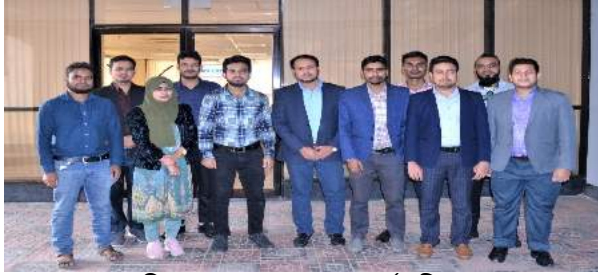
চিত্র : নবযোগদানকৃত কর্মচারীগণ

০১ নভেম্বর ২০২১ তারিখ (১৩-২০) গ্রেড ভুক্ত ১৩জন কর্মচারী বাংলাদেশ সেতু কর্তৃপক্ষে যোগদান করেন। যোগদান পরবর্তী তাদের অরিয়েন্টেশন সম্পন্ন করে বিভিন্ন অনুবিভাগে পদায়ন করা হয়।