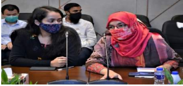
চিত্র : সুশাসন প্রতিষ্ঠার নিমিত্ত অংশীজন সভা

গত ২৯ ডিসেম্বর ২০২১ তারিখে বাংলাদেশ সেতু কর্তৃপক্ষের সেবা প্রদানকারী ঠিকাদারদের সম্মুখে সুশাসন প্রতিষ্ঠার নিমিত্ত সেতু ভবনে অংশীজনের সঙ্গে মতবিনিময় সভা অনুষ্ঠিত হয়।