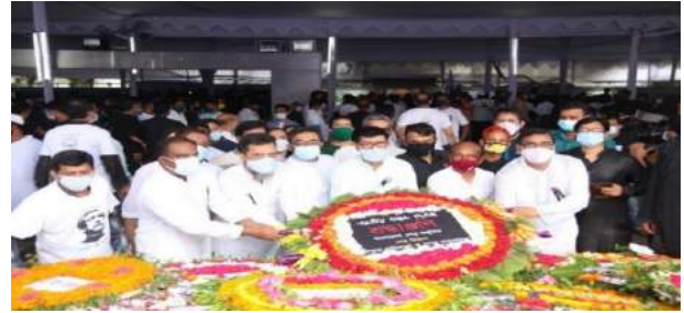
চিত্র : জাতির পিতার প্রতিকৃতিতে পুষ্পস্তবক অর্পণ