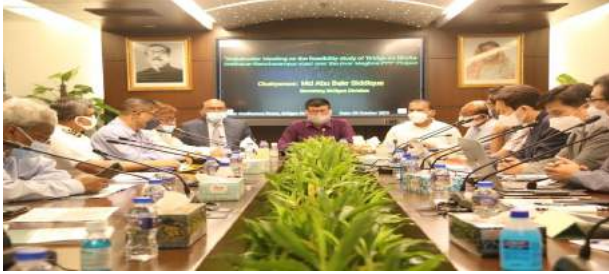
চিত্র : অংশীজন সভায় নির্বাহী পরিচালক