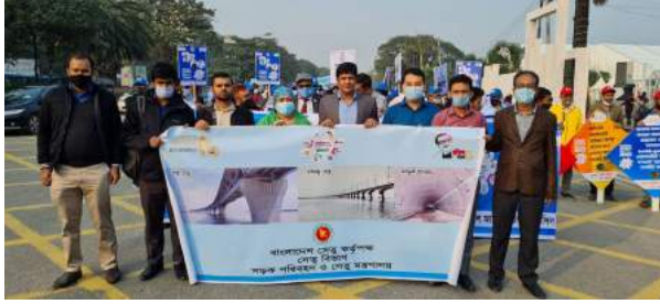
চিত্র : ডিজিটাল বাংলাদেশ উদযাপন অনুষ্ঠানে অংশগ্রহণ

পঞ্চমবারের মতো সারা দেশে উদযাপিত হয়েছে ডিজিটাল বাংলাদেশ দিবস। 'ডিজিটাল বাংলাদেশের অর্জন, উপকৃত সকল জনগণ' এই প্রতিপাদ্য বিষয় নিয়ে ১২ ডিসেম্বর ২০২১ তারিখ দিবসটি উদযাপিত হয়। ডিজিটাল বাংলাদেশ দিবস ২০২১ উদযাপন উপলক্ষ্যে আয়োজিত বর্ণাঢ্য অনুষ্ঠানে সেতু বিভাগ ও বাংলাদেশ সেতু কর্তৃপক্ষের বিভিন্ন পর্যায়ের কর্মকর্তা-কর্মচারীগণ। এতে প্রধান অতিথি হিসেবে উপস্থিত ছিলেন জাতীয় সংসদের প্রধান হইপ নূর-ই-আলম চৌধুরী। আইসিটি প্রতিমন্ত্রী জুনাইদ আহমেদ পলকের নেতৃত্বে বর্ণাঢ্য শোভাযাত্রাটি জাতীয় সংসদের দক্ষিণ প্লাজা হতে শুরু করে খামারবাড়ি হয়ে পুনরায় দক্ষিণ প্লাজায় গিয়ে শেষ হয়। পরবর্তিতে উদ্বোধনী অনুষ্ঠান, দিনব্যাপী অন্যান্য অনুষ্ঠানে উক্ত কর্মকর্তা-কর্মচারীগণ অংশগ্রহণ করেন।