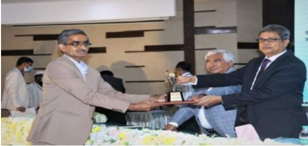
চিত্র : পরিচালক (অর্থ ও হিসাব) কর্তৃক জাতীয় রাজস্ব বোর্ড এর চেয়ারম্যান-এর নিকট হতে ট্যাক্স কার্ড ও সম্মাননা পত্র গ্রহণ

জাতির পিতা বঙ্গবন্ধু শেখ মুজিবুর রহমান এর সোনার বাংলা বিনির্মাণে বাংলাদেশ সেতু কর্তৃপক্ষ নিয়মিত কর প্রদান করে অগ্রণী ভূমিকা পালন করে আসছে। বাংলাদেশ সেতু কর্তৃপক্ষ ২০২০-২১ কর বছরে "স্থানীয় কর্তৃপক্ষ" খাতে ২য় সর্বোচ্চ আয়কর প্রদানকারী হিসেবে নির্বাচিত হয়েছে।