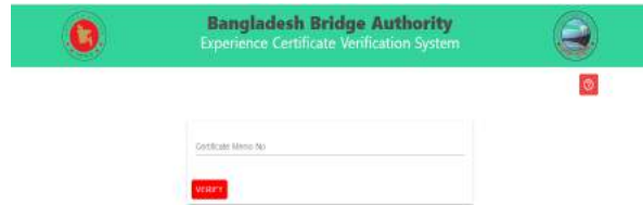
চিত্র : অনলাইন অভিজ্ঞতা সনদ ভেরিফিকেশন সিস্টেম

বাংলাদেশ সেতু কর্তৃপক্ষের আওতাধীন যাবতীয় ক্রয় কার্য ঠিকাদার প্রতিষ্ঠানের মাধ্যমে সম্পন্ন হয়ে থাকে। ক্রয় কার্য সফলভাবে সম্পন্ন হওয়ার পর তাদেরকে কার্য সম্পাদন সনদ প্রদান করা হয়। এটি বাংলাদেশ সেতু কর্তৃপক্ষ কর্তৃক ক্রয়কারী প্রতিষ্ঠানকে প্রদত্ত একটি সেবা এই সেবাটি ডিজিটাইজেশনের উদ্দেশ্যে বাংলাদেশ সেতু কর্তৃপক্ষ অনলাইন প্ল্যাটফর্মে 'অনলাইন অভিজ্ঞতা সনদ ভেরিফিকেশন সিস্টেম' নামের একটি ওয়েবভিত্তিক সফটওয়্যার চালু করেছে। সফটওয়্যারটি ওয়েব লিংকের সাথে সংযুক্ত। লিংকে করতে https://eservice.bba.gov.bd/certificates । উক্ত সফটওয়্যারটি ৩০ ডিসেম্বর ২০২১ তারিখে ঠিকাদারদের জন্য উন্মুক্ত করা হয়েছে। সফটওয়্যারটি বাংলাদেশ সেতু কর্তৃপক্ষের ওয়েব পোর্টাল www.bba.gov.bd এর 'আভ্যন্তরীণ ই-সেবাসমূহ' আওতায় সংযুক্ত করা হয়েছে।