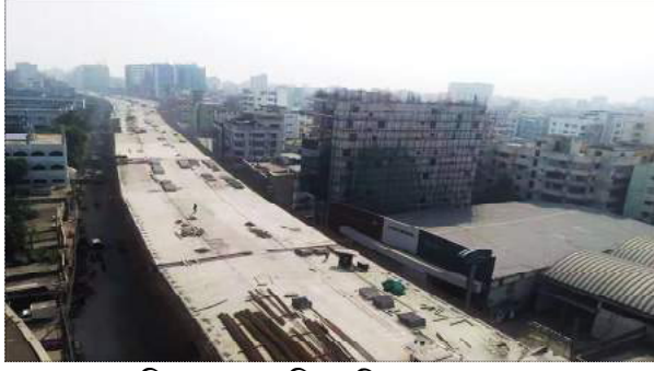
চিত্র : চলমান বিআরটি প্রকল্পের কাজ

প্রকল্পের এলিভেটেড অংশ ছাড়াও At-grade এ দ্রুতগতির যানবাহন চলাচলের জন্য ০৪ লেনের MT Lane এর পাশাপাশি ধীরগতির যানবাহন চলাচলের জন্য পৃথক ০২ লেন বিশিষ্ট NMT Lane নির্মাণ করা হচ্ছে। এ কাজগুলো সম্পন্ন হলে সড়কটি দিয়ে নিরবচ্ছিন্নভাবে যানবাহন চলাচল করতে পারবে এবং জনসাধারণ দ্রুততম সময়ে গন্তব্যস্থলে পৌঁছাতে পারবে। আগামী জুন ২০২২ এর মধ্যে প্রকল্পের কাজ সম্পন্ন করার লক্ষ্যে বাংলাদেশ সেতু কর্তৃপক্ষ নিরলসভাবে কাজ করে যাচ্ছে।