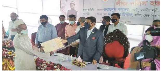
চিত্র : পুনর্বাসন ভিলেজে বরাদ্দকৃত প্লটের লীজ দলিল হস্তান্তরে মাননীয় মন্ত্রী জনাব ওবায়দুল কাদের এম.পি.

সড়ক পরিবহন ও সেতু মন্ত্রণালয়-এর মাননীয় মন্ত্রী জনাব ওবায়দুল কাদের এম.পি ০৩ অক্টোবর/২০২১ তারিখ পদ্মা বহুমুখী সেতু নির্মাণ প্রকল্পের পুনর্বাসন ভিলেজে বরাদ্দকৃত প্লটের লীজ দলিল হস্তান্তর অনুষ্ঠানে প্রধান অতিথি হিসেবে উপস্থিত থেকে লীজ দলিল হস্তান্তর করেন।