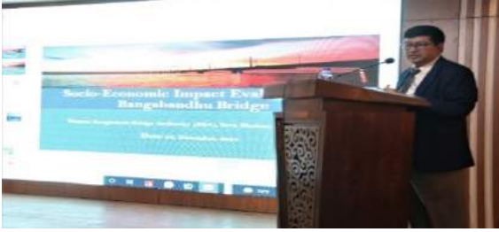
চিত্র : আর্থ-সামাজিক প্রভাব মূল্যায়ন প্রতিবেদন উপস্থাপন অনুষ্ঠানে নির্বাহী পরিচালক

বাংলাদেশ সেতু কর্তৃপক্ষের আওতাধীন বঙ্গবন্ধু সেতু নির্মাণের পর ১৯৯৮ সালের ২৩ জুন যান চলাচলের জন্য উন্মুক্ত করা হয়। এ সেতু নির্মাণের ফলে যাতায়াত ব্যবস্থা যেমন সহজতর হয়েছে তেমনি উত্তরাঞ্চলে কৃষি পণ্যাদি উৎপাদনের পরিমাণ উল্লেখযোগ্য হারে বৃদ্ধি পেয়েছে এবং কৃষকরা তাদের পণ্যের ন্যায্য মূল্যও পাচ্ছেন। ২৩ ডিসেম্বর ২০২১ তারিখ ঢাকা বিশ্ববিদ্যালয়ের ইনস্টিটিউট অফ সোশ্যাল ওয়েলফেয়ার এন্ড রিসার্চ বঙ্গবন্ধু সেতুর আর্থসামাজিক প্রভাব মূল্যায়নের ড্রাফট ফাইনাল রিপোর্ট দাখিল করে। বঙ্গবন্ধু সেতু উদ্বোধনের পর হতে বর্তমান সময় পর্যন্ত আর্থ-সামাজিক প্রভাব মূল্যায়নে সেতুটির ভূমিকা নিরূপণের উদ্দেশ্যে গত ১৩ এপ্রিল ২০২১ তারিখে বাংলাদেশ সেতু কর্তৃপক্ষ এবং ঢাকা বিশ্ববিদ্যালয়ের ইনস্টিটিউট অফ সোশ্যাল ওয়েলফেয়ার এন্ড রিসার্চ-এর মধ্যে একটি চুক্তি স্বাক্ষরিত হয়।