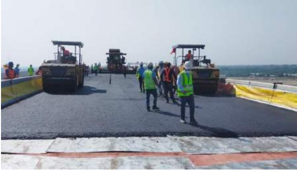
চিত্র : পদ্মা সেতুর সড়ক পথের পিচ ঢালাই শুরু

পদ্মা বহুমুখী সেতুর সড়ক পথের পিচ ঢালাই শুরু হয়েছে। দুই স্তর মিলিয়ে একশ মিলিমিটার পুরুত্বের পিচ ঢালাই [কার্পেটিং] হবে। এর মধ্যে প্রথম স্তর হবে ৬০ মিলিমিটার এবং দ্বিতীয় স্তর হবে ৪০ মিলিমিটার। গত ১০ নভেম্বর ২০২১ তারিখ সকাল ১০টার দিকে ৪০ নম্বর পিলার থেকে এ পিচ ঢালাই কার্যক্রম শুরু হয়।