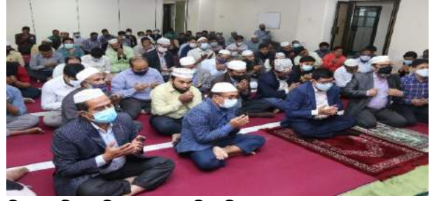
চিত্র : শহীদ মুক্তিযোদ্ধাদের বিদেহী আত্মার মাগফেরাত কামনায় কর্মকর্তা-কর্মচারীগণ

গত ১৫ ডিসেম্বর ২০২১ তারিখে মহান বিজয় দিবস উপলক্ষ্যে শহীদ মুক্তিযোদ্ধাদের বিদেহী আত্মার মাগফেরাত ও যুদ্ধাহত মুক্তিযোদ্ধাদের সুস্বাস্থ্য এবং জাতির শান্তি, সমৃদ্ধি ও অগ্রগতি কামনা করে সেতু ভবনের নামাজের কক্ষে বাদ যোহর বিশেষ মোনাজাত ও প্রার্থনা করা হয়।