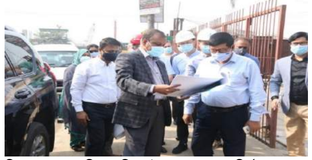
চিত্র : ঢাকা-আশুলিয়া এলিভেটেড এক্সপ্রেসওয়ে নির্মাণ প্রকল্পের এলাইনমেন্ট পরিদর্শনে নির্বাহী পরিচালক